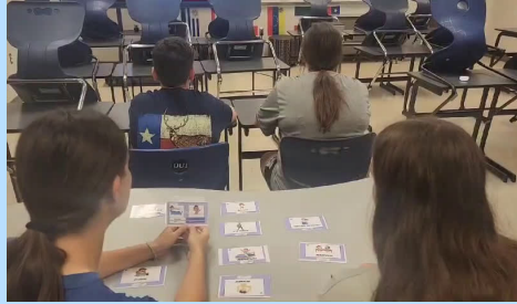
Yo me baño