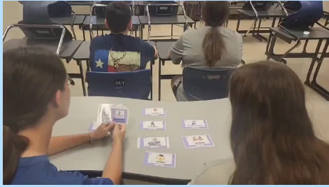
Yo me levanto