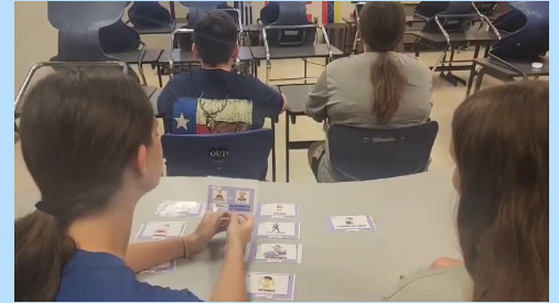
Yo desayuno una naranja